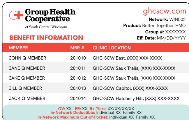
Parte frontal de la tarjeta de identificación de membresía